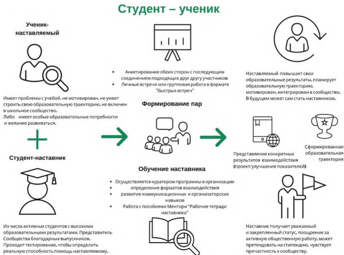
Рис. 3. Графическое представление реализации программы наставничества по форме «студент – ученик».