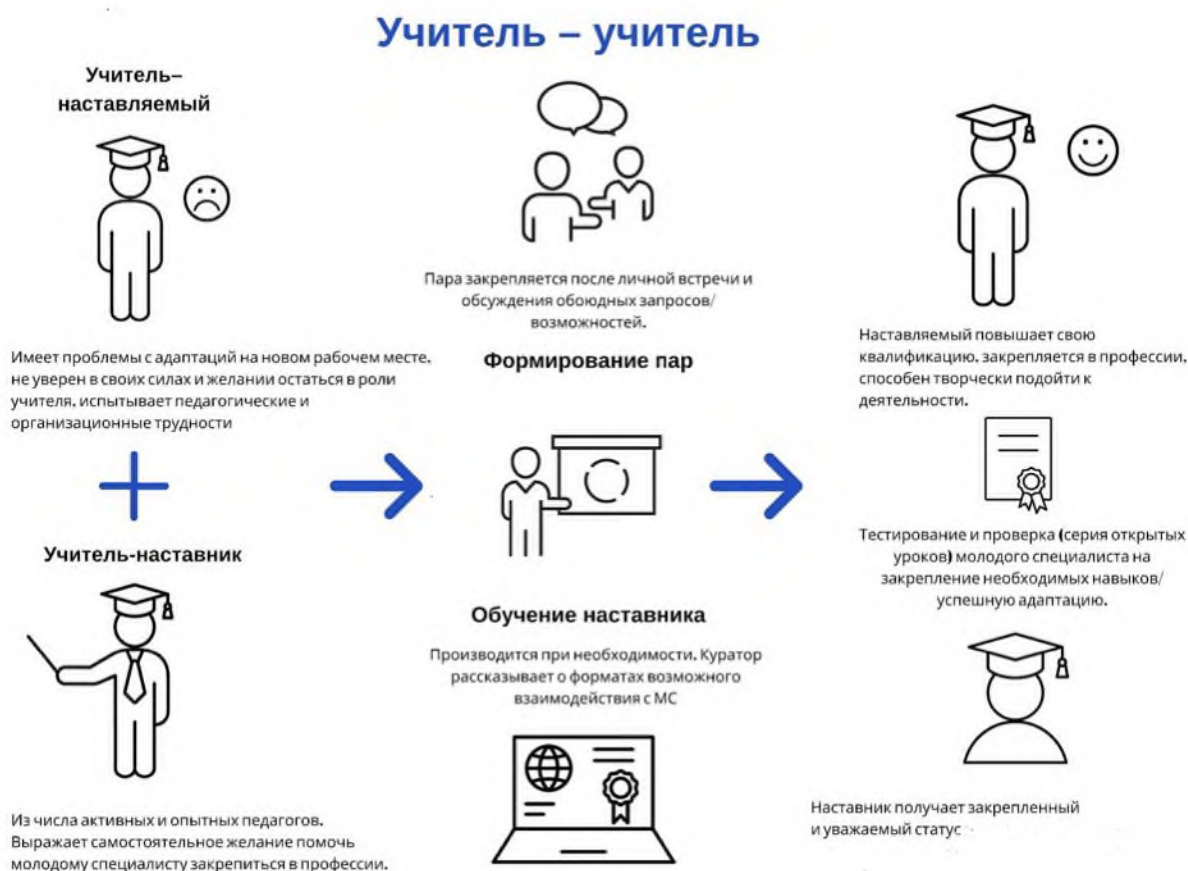
Рис. 2. Графическое представление реализации программы наставничества по форме «учитель – учитель».