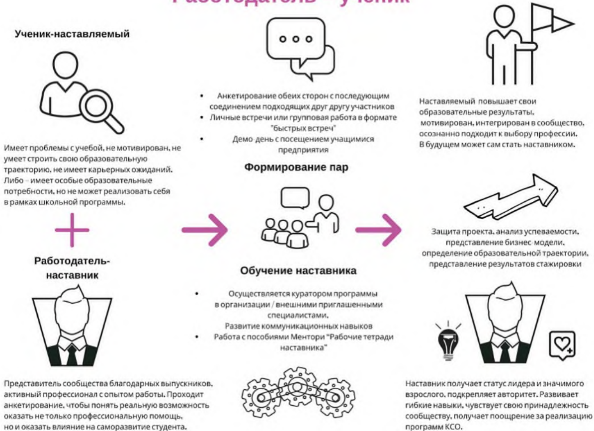
Рис. 4. Графическое представление реализации программы наставничества по форме «работодатель – ученик».