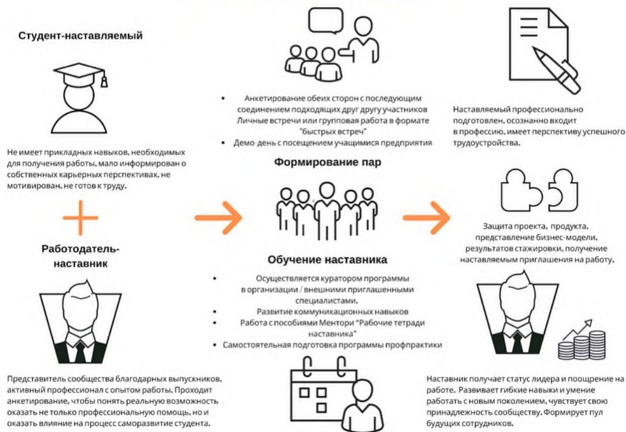
Рис. 5. Графическое представление реализации программы наставничества по форме «работодатель – ученик».